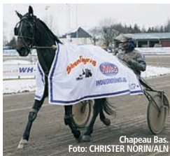
Chapeau Bas.