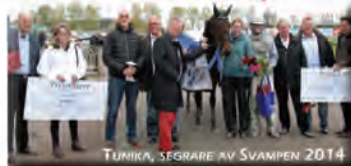
TUMIKKA, SEGRARE AV SVAMPEN 2014

INFORMATION: Claes Broberg, sportchef 073-840 88 18