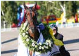
CAPITOL HILL Vinnare av E3 för h/v 2017