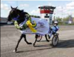
CALAMARA'S GIRL Vinnare av E3 för ston 2017