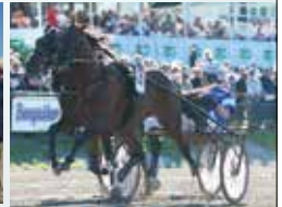
COIN PERDU Vinnare av korta E3 för h/v 2017

I E3-serien tävlar europeiska 3-åringar om cirka 16 miljoner kronor.