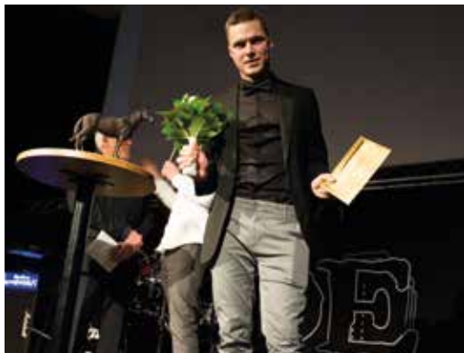
ÅRETS PONNY KATEGORI A - EMMEROS ALERT