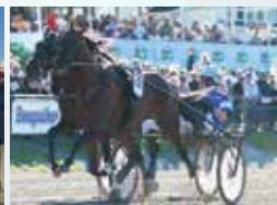
COIN PERDU Vinnare av korta E3 för h/v 2017

I E3-serien tävlar europeiska 3-åringar om cirka 18 miljoner kronor.