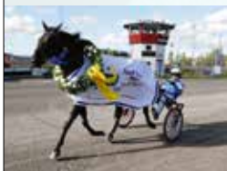
CALAMARA'S GIRL Vinnare av E3 för ston 2017