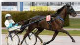
Fredrik Wallins Inga in Heaven var den Gävlehäst som sprang in mest pengar under 2017!