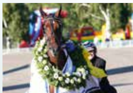
CAPITOL HILL Vinnare av E3 för h/v 2017